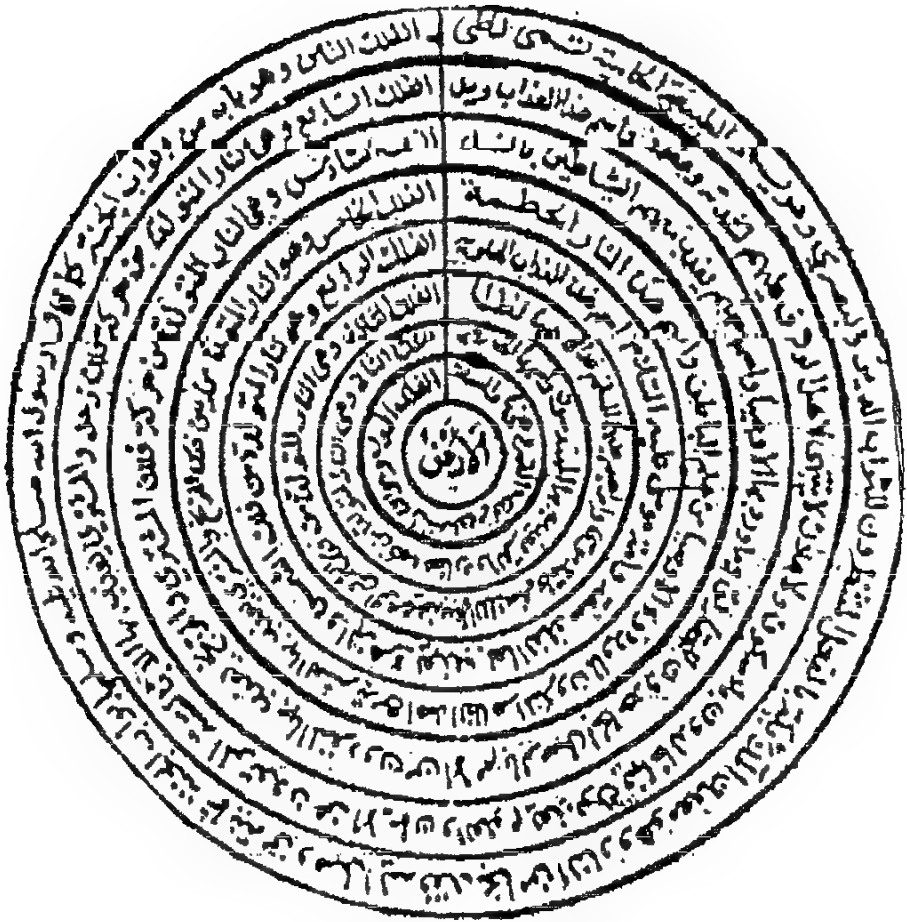
صورة دوائر الأفلاك عند الاسماعيلية